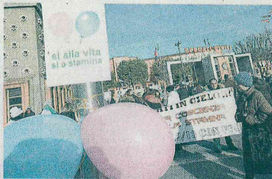
Proteste e polemiche Striscioni e palloncini davanti al Civile per il caso Stamina

A Torino un giudice vorrebbe bloccare tutto definitivamente. Difficoltà logistiche per ora impediscono di ripartire